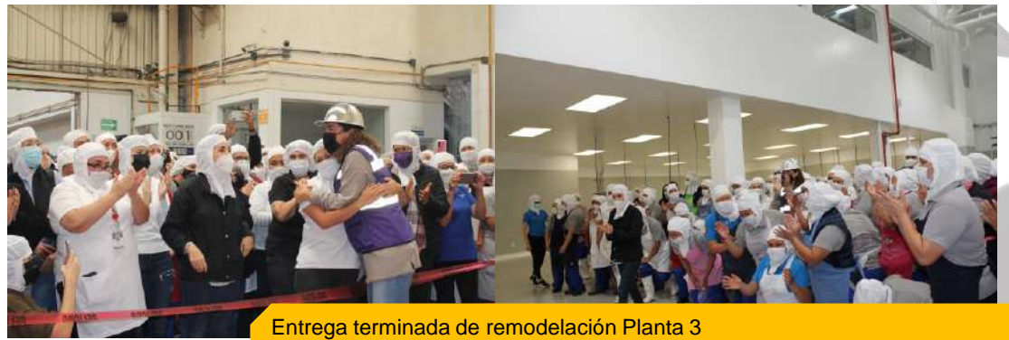
Entrega terminada de remodelación Planta 3

Éste proyecto contempla espacios más amplios, uso de tecnología ecológica y sustentable. Además de garantizar espacios cómodos y seguros para todo el equipo.