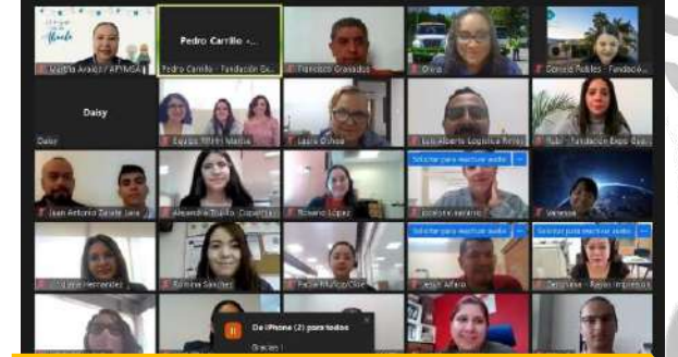
Reunión presencial/virtual en Mesas de Asesorías Fundación Expo Guadalajara