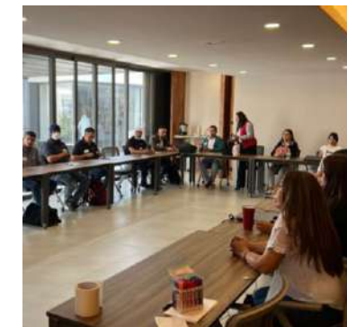
Sesión Box Score, presentación de Política de Toma de Decisiones.

Conflictos de Interés. situaciones en las que el juicio de un sujeto, en lo relacionado a un interés primario para él o ella, y la integridad de sus acciones, tienen a estar indebidamente influenciadas por un interés secundario, el cual frecuentemente es de tipo económico o personal.