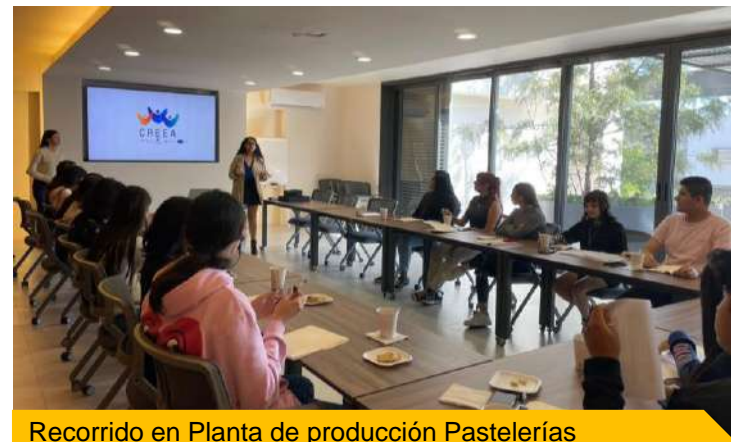
Recorrido en Planta de producción Pastelerías Marisa a CREEA Coparmex 2022