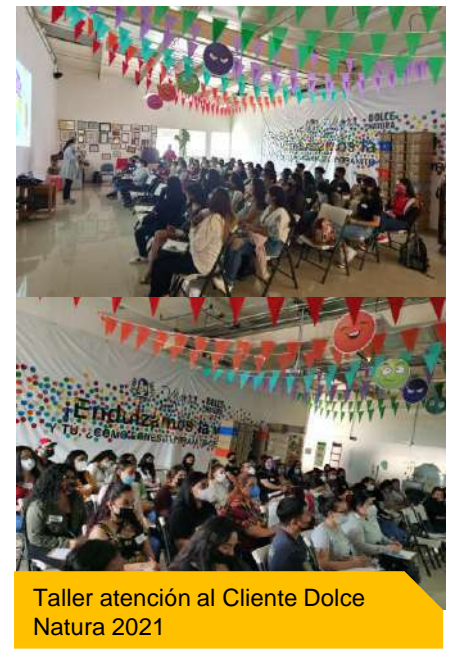
Taller atención al Cliente Dolce Natura 2021