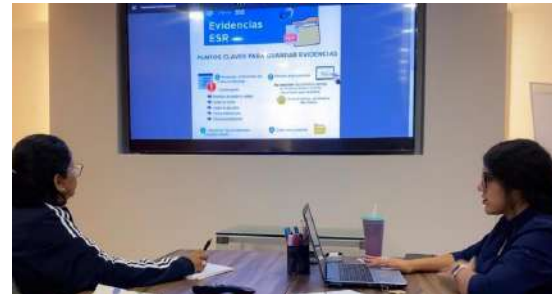
Reuniones individuales Líderes de Comité de RSE 2022

El comité es la figura clave para impulsar y generar ideas sustentables, además de recabar y documentar nuestras acciones de responsabilidad social, buscando que nuestras prácticas sumen a los Objetivos de Desarrollo Sostenible.