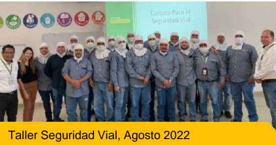
Taller Seguridad Vial, Agosto 2022

Aprendieron temas como: Movilidad sustentable, marco legal, antisoborno, técnica de conducción segura entre otros temas.