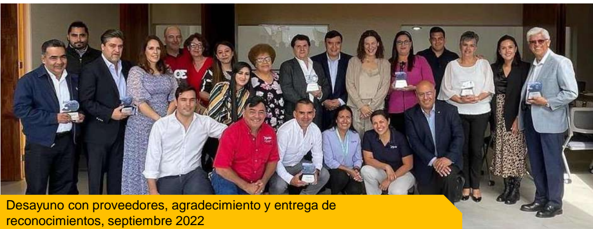
Desayuno con proveedores, agradecimiento y entrega de reconocimientos, septiembre 2022