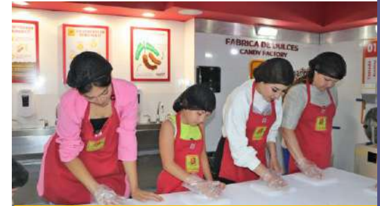
Evento Día de la familia Guadalajara, Jal. Agosto 2023