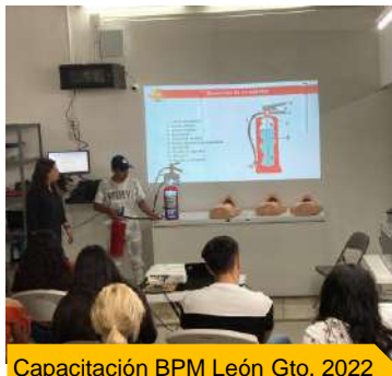
Capacitación BPM León Gto. 2022