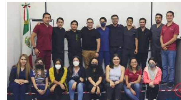
Capacitación equipo área médica Marisa 2023

Nuestro equipo de área de salud se capacitó en el curso de electrocardiograma, soporte vital básico, y soporte vital cardiovascular avanzado, con una duración de 3 días otorgado por Kabanta quienes están Certificados por la American Heart Association (AHA).