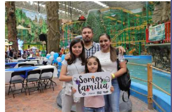
Evento Día de la familia León Gto. Agosto 2023.