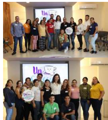
4ta generación de prepa Marisa

Prepa Marisa, es nuestro programa de apoyo para que colaboradores/as de Pastelerías Marisa cursen sus estudios de Preparatoria.