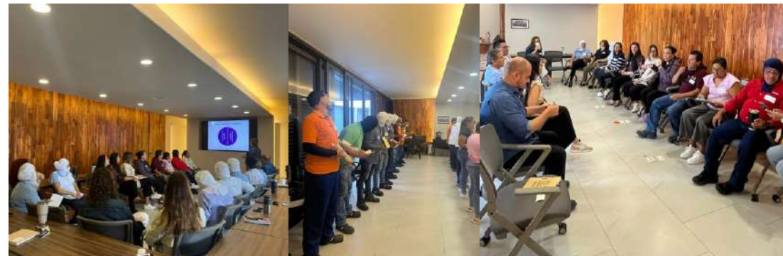
Curso de liderazgo impartido a nuestrxs líderes 2023

En 2023 se impartieron sesiones de liderazgo, en las cuales participaron 57 colaboradores/as, Supervisores y supervisoras de ventas, producción y parte del equipo staff administrativo y de dirección. Aprendieron temas que fortalecen su liderazgo en la empresa.