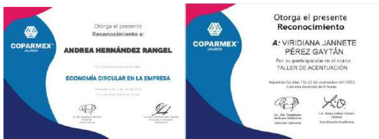
Constancias de cursos de personal de Staff 2023

Tuvimos la participación de 34 personas. Actualmente continuamos con asesorías para seguir implementando de manera integral la gestión de la cadena de suministro.