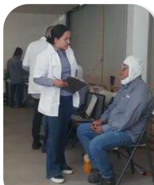
Campaña de salud visual 2023 143 personas participaron

Además, creamos alianza con casa Uhane, quien ofrece acompañamiento psicológico a personas que han sufrido violencia doméstica, problemas de autoestima, o discriminación LGBTIQ+.