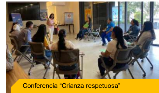
Conferencia "Crianza respetuosa"

Para padres y madres que trabajan en Marisa, se impartieron dos conferencias, y un taller de cinco sesiones, en las que aprendieron técnicas sobre como conectar con sus hijas/os, alternativas positivas para suplir castigos, resolución de conflictos en la familia.