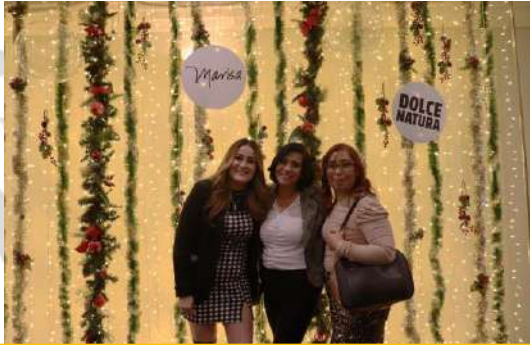
Foto de nuestras colaboradoras en la posada Marisa 2022

Disfrutamos de una fiesta de cierre de año 2022, en la que además de diversión, rifamos más de 450 regalos, celebramos en un salón de eventos con rica cena, snacks y mucho baile.