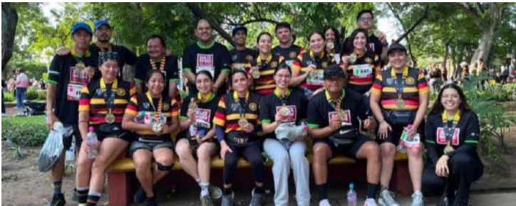
Equipo runners Marisa 2023

En 2022 decidimos dar empuje a nuestrxs colaboradorxs que aman el deporte y les apasiona correr, por eso, apoyamos a 22 corredores y corredoras con las carreras de paga, así como entrenamiento y acompañamiento particular con un coach.