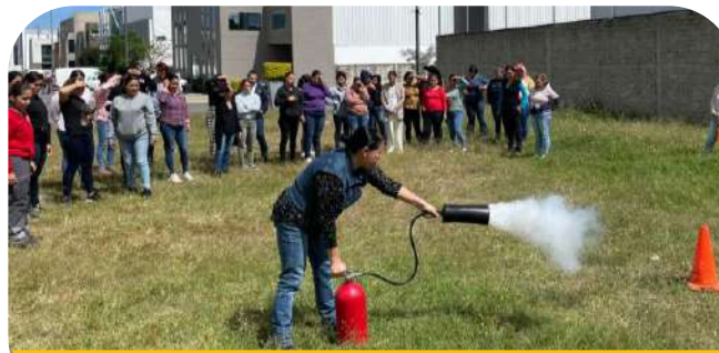
Capacitación Brigadas equipo ventas, Octubre 2022

Además de Higiene y salubridad en el manejo de alimentos.