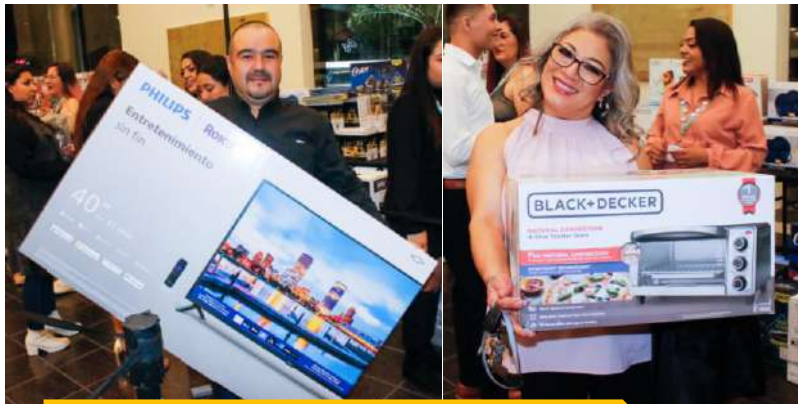
Ganadorxs de nuestra rifa

Se tomaron todas las medidas de seguridad para que pudieran disfrutar al máximo su posada 2022.